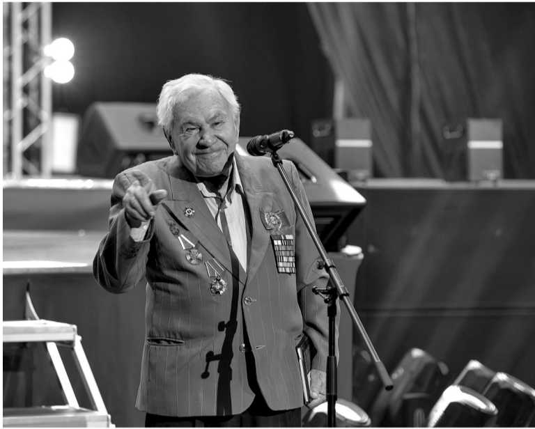
Продолжение. Начало на стр. 1