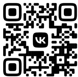
КИНОЗАЛ СЕВЕР (ВОРГАШОР)