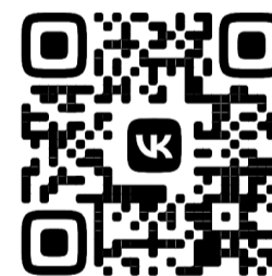
КИНОЗАЛ СЕВЕР (ВОРГАШОР)