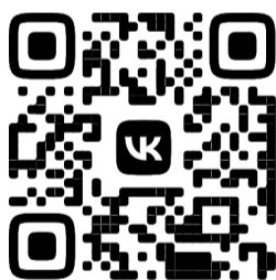
УПРАВЛЕНИЕ ГО ЧС