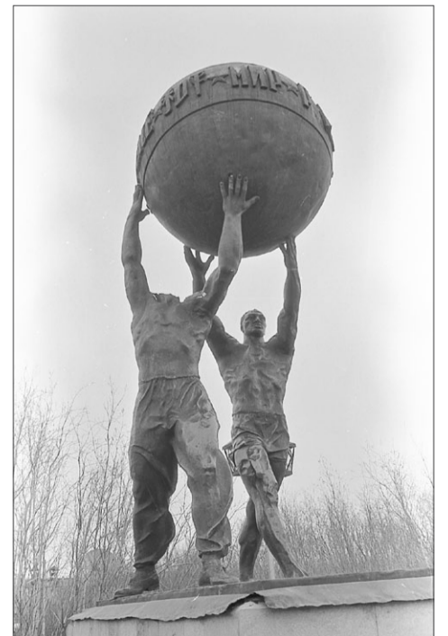
ВАРВАРСКИ ИСКАЛЧЕННЫЙ ПАМЯТНИК В ПАРКЕ.