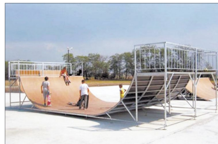
МИНИ-РАМПА. ЭТА КОНСТРУКЦИЯ СТАНЕТ КЛЮЧЕВОЙ В ОБНОВЛЕННОМ ВОРКУТИНСКОМ СКЕЙТ-ПАРКЕ