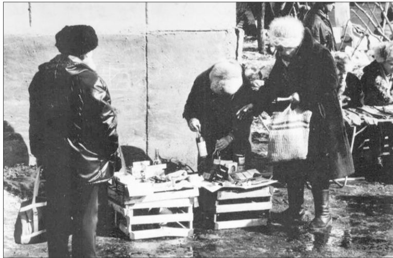
ТОРГОВЛЯ С ЯЩИКОВ. «ЗАПОЛЯРЬЕ», 27 АПРЕЛЯ 1993 ГОДА.

Как и в прошлом году, не хватает денег на выдачу зарплаты и отпускных. Воркутинский городской рабочий комитет предупреждает все ветви власти о тяжелых последствиях (22, 27 мая). Из-за того, что не выполняется тарифное соглашение с правительством, вновь объявил предзабастовочное состояние НПП Воркуты (1 июня). Несколько дней бастовали на «Заполярьем». Поводом послужило то, что руководство шахты назначило вначале одну цену на поступившие бартерные телевизоры, затем резко ее увеличило. Заодно выдвину-