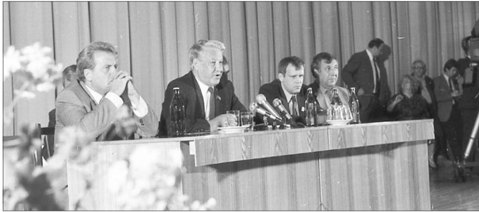
ВИЗИТ Б. Н. ЕЛЬЦИНА В ВОРКУТУ. «ЗАПОЛЯРЬЕ», 15 АВГУСТА 1990 ГОДА

Но более всего ветеранов Воркуты интересует, конечно, жилье за пределами города. В уже упомянутом постановлении Совета Министров СССР № 230 предусмотрено строительство не только кооперативного, но и государственного жилья: до 1995 года 30 домов в РСФСР и семь – на Украине. Есть при этом масса организационных проблем. А в очереди только «Воркутауголь» уже 10 – 11 тысяч пенсионеров и инвалидов. Так что строить и строить (22 июня).