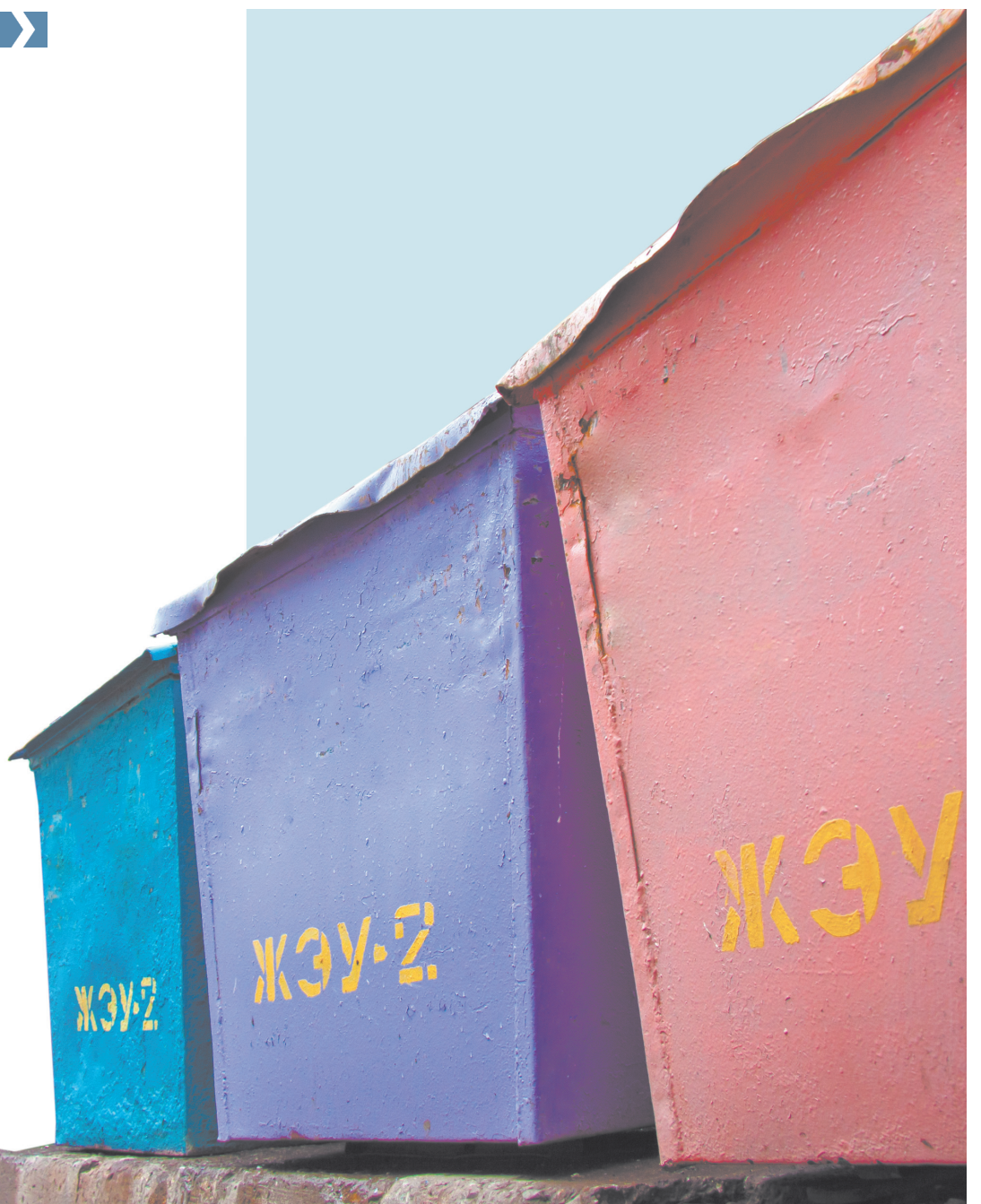
ЦВЕТА РАДУГИ. ПОБЕДИТЕЛЕМ ЖУРНАЛИСТСКОГО КОНКУРСА СТАЛО ЖЭУ-2

Проголосовать можно на сайте заполярка-онлайн.рф